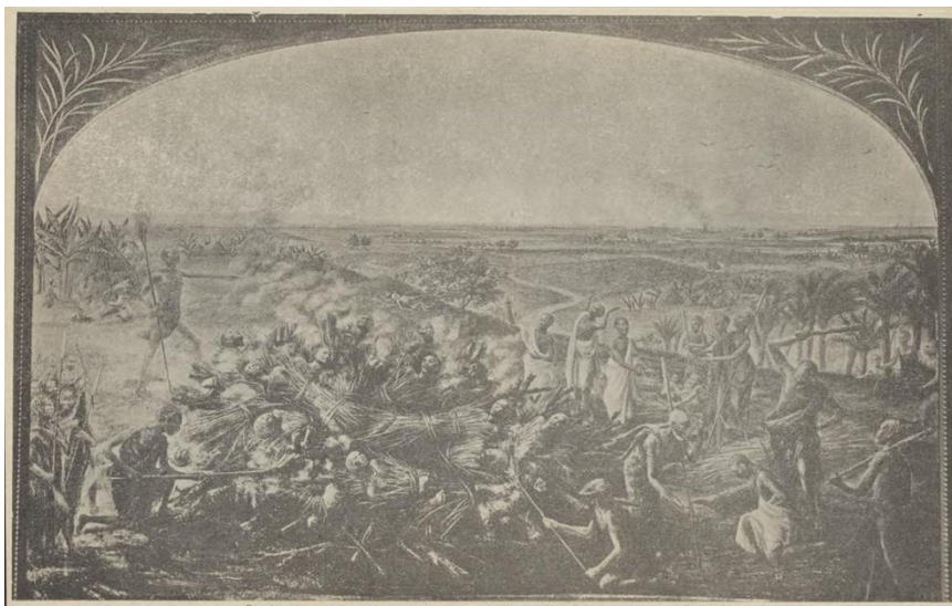
De gruwelijkheden in beeld gebracht.